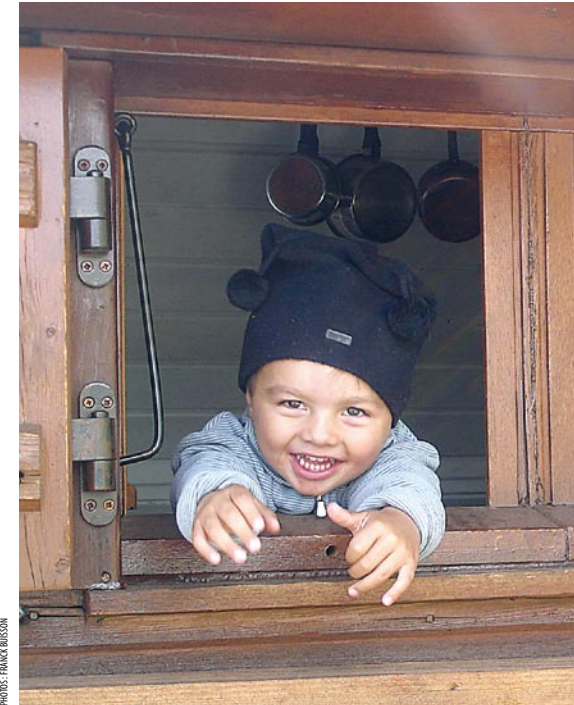
LAURENT LAGUENAN