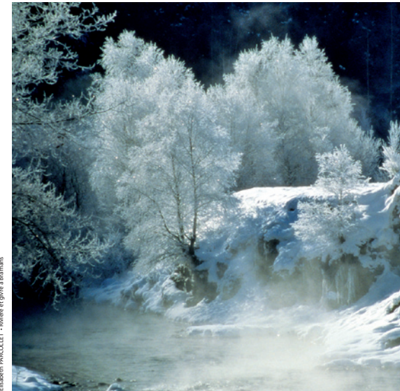
LAURENT MARCHAL / COMITÉ DES ÉCRIVAINS - ELISABETH PARCOLLET - Rivière et givre à Bramans