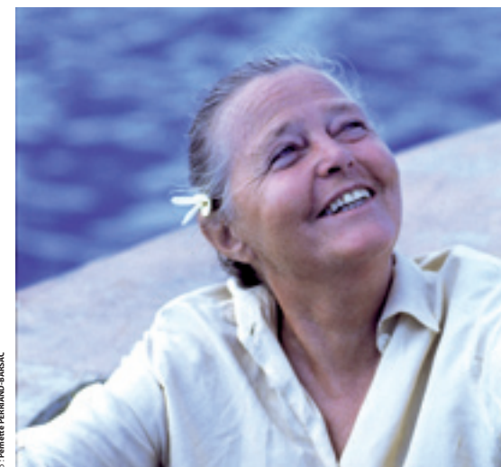
LAURENT MAISON.COM / MONTA NEA / CREATION

En partenariat avec : Conseil général de la Savoie, Région Rhône-Alpes, DRAC Rhône-Alpes, Fondation Braillard Architectes, Bourg-Saint-Maurice Les Arcs, Méribel Les Allues