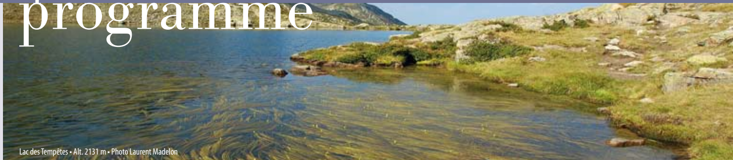
Lac des Tempêtes • Alt. 2131 m

Lorsque l'on pense aux Alpes, dans notre imaginaire se dressent d'abord des montagnes, et la naissance des grands fleuves européens.