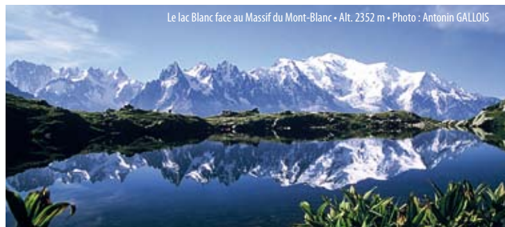
Le lac Blanc face au Massif du Mont-Blanc • Alt. 2352 m