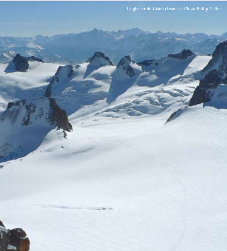
Le glacier du Géant (France)

Philip DELINE - Géographe, Maître de conférences à l'Université de Savoie