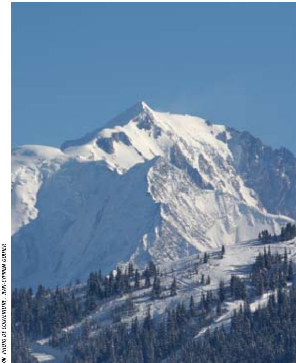
LAURENT MAISON.COM - PHOTO DE COURTESURE - JEAN-CRISTOPHE GOURIER